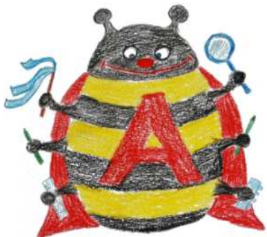
Avastaja Põrnikas (autor Jaanika Sirp, Pärnu Ülejõe Lasteaed, 2012)

Avastusõppe meetodi kaudu saab ellu rakendada üldõpetuse printsiipidele toetuvat koolieelse lasteasutuse ja üldhariduskooli õppekava. See on parim meetod kooliküpsuse saavutamiseks – nii läheb kooli teadmishimuline, suhtlusaldis ja rõõmsameelne laps.